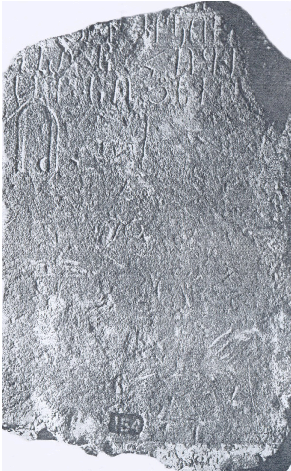
Рис. 2. Армянская надпись постамента креста Мцхетского Джвари